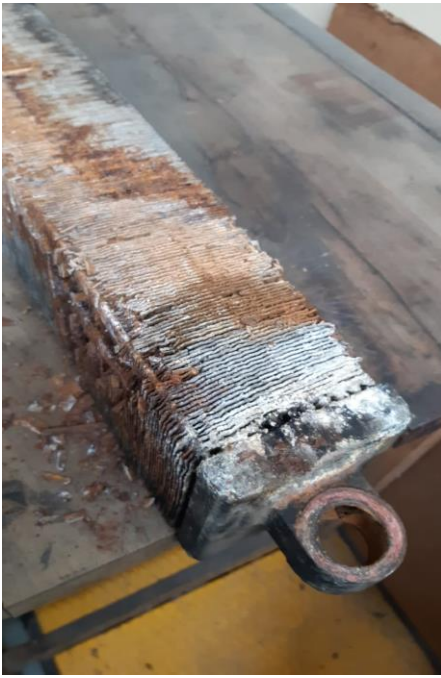
Ilustración 1: Panel Radiador a Reparar